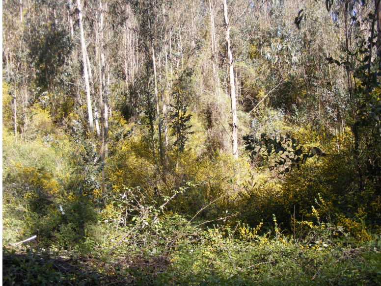
Terreno con vegetación