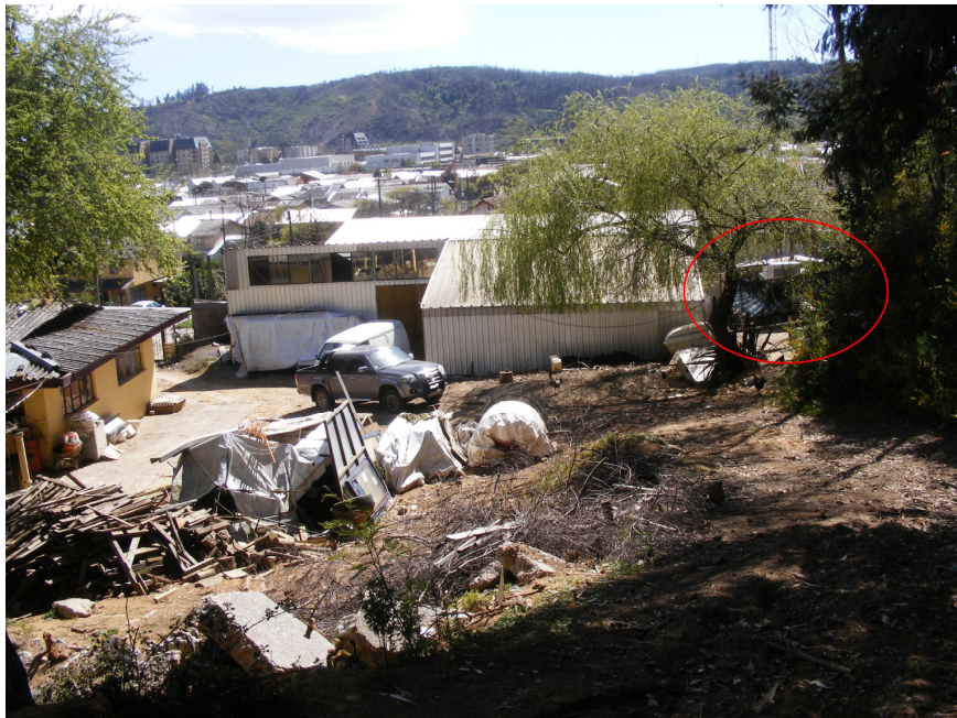
Plano General (El círculo rojo indica el gallinero)