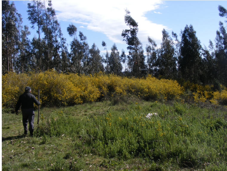
250 metros de altura, vista a Nonguén