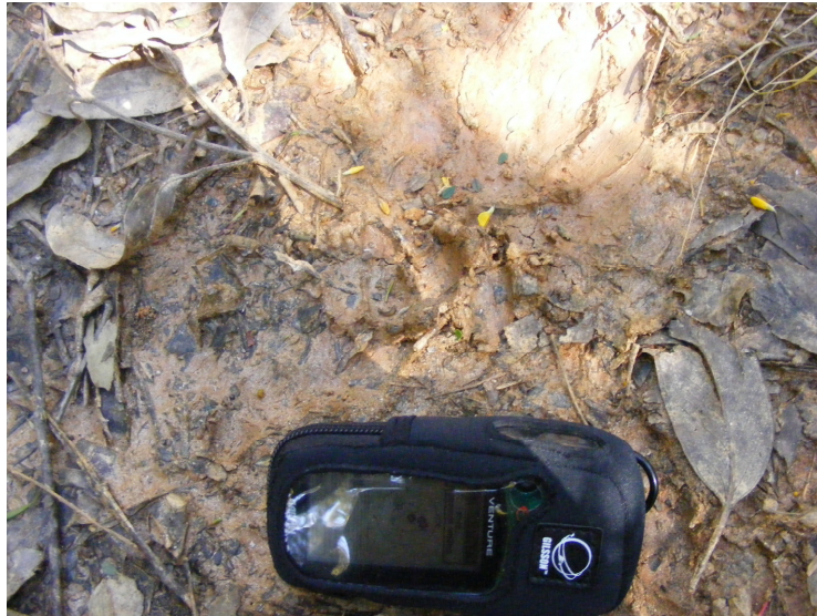
Huellas junto a GPS (Referencia)