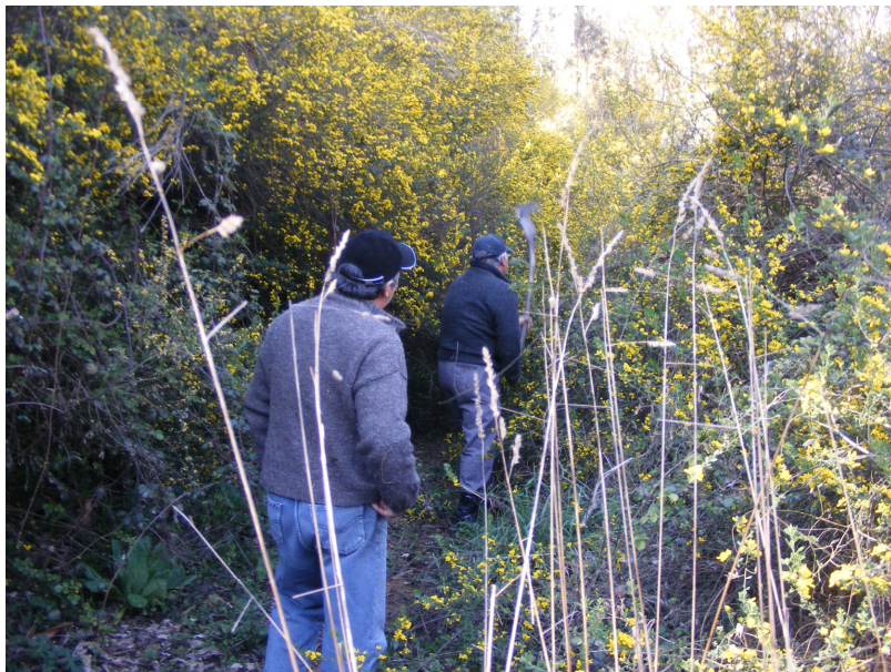
Buscando el sendero