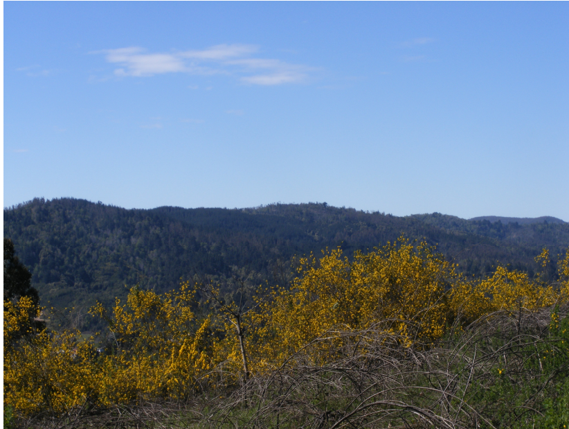
Vista General del terreno