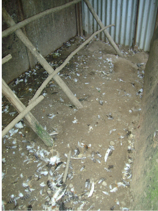
Interior del Gallinero